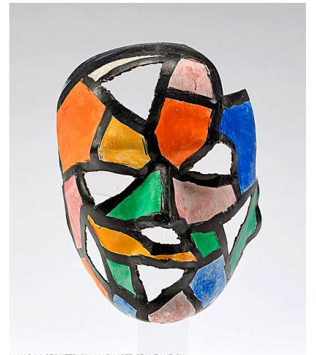
MAN RAY, GEOMETRICAL MASK, 1953, 23 X 17 X 13 CM

Der stilvolle Begleiter für Leute, für die Tauchen mehr ist als ein Ferienhobby. 4200 Franken.